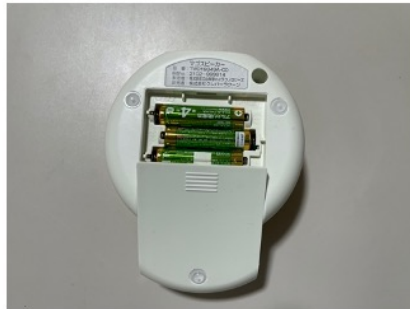
赤外線人感センサー内蔵（事件事故の防止）